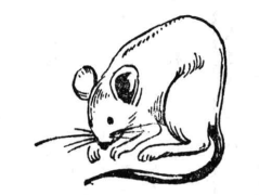
わたくしは 公明選挙運動の参加者です